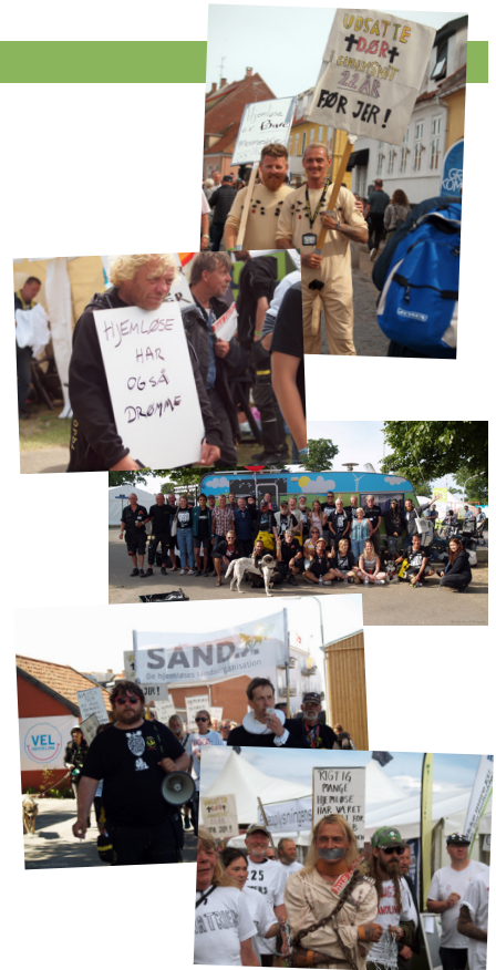
I mange år har juni været ensbetydende med Folkemøde på Bornholm. I år er juni, som så mange andre måneder, anderledes men det skal ikke stoppe os i at tage ud og markere os i landet. I juni vil der være flere aktioner, rundt i landet og du kan følge med i hvor og hvornår vi er nær dig. Kalenderen vil blive opdateret på vores hjemmeside og Facebookside.

Kontakt os på 89 93 70 60 hvis der er noget du er i tvivl om eller vil meldes til!